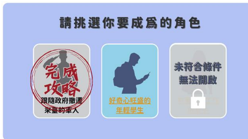
圖1 影片遊戲選角畫面

求配上音效，將之串聯成連續動畫，影片主要呈現為主角進行三位遊戲角色的遊戲攻略，在選角過程中出現的選擇畫面，則為「模擬沈浸式遊戲」的效果（如圖1）。