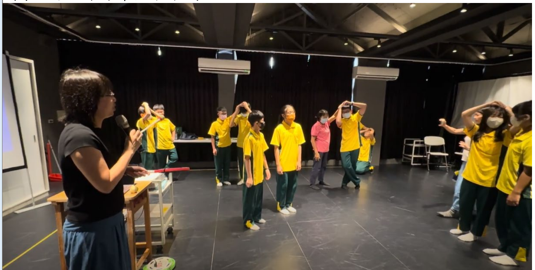
(請學生出來示範如何舞台打鬥抓頭髮。)