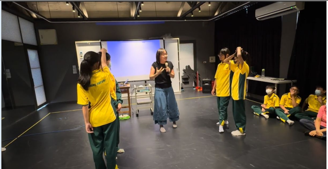
(學生分組練習舞台打鬥。)