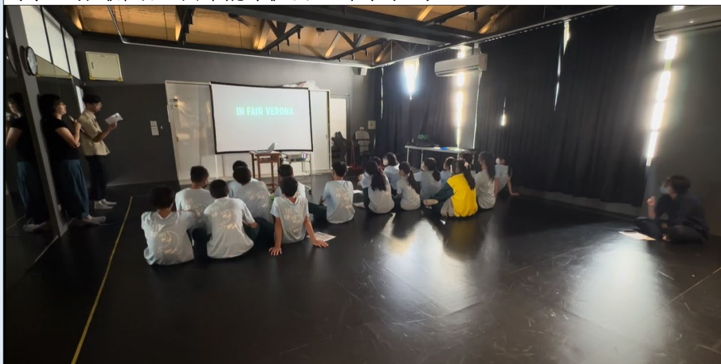
(《羅密歐與茱麗葉》電影欣賞。)