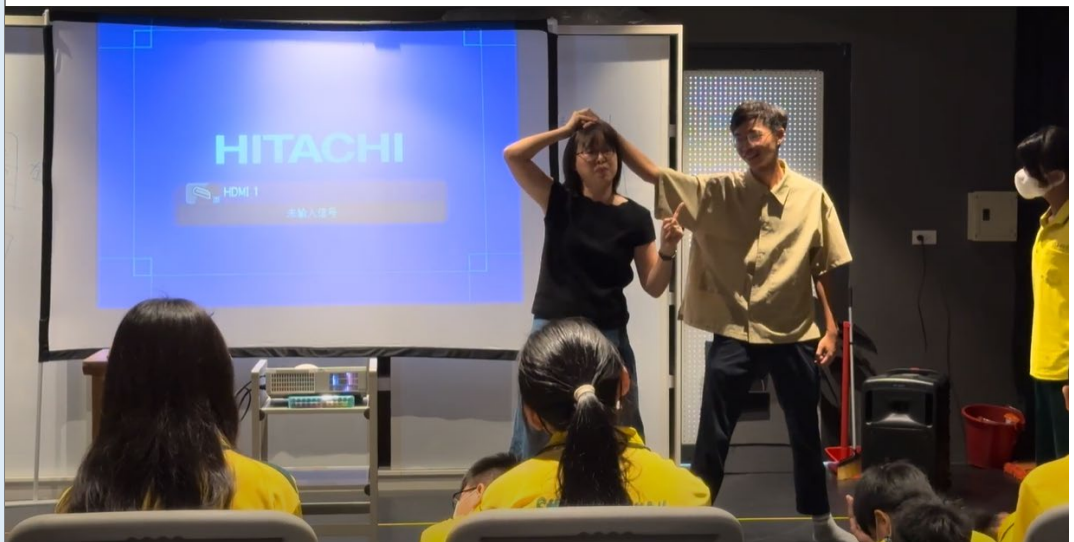
(教師示範舞台打鬥。)