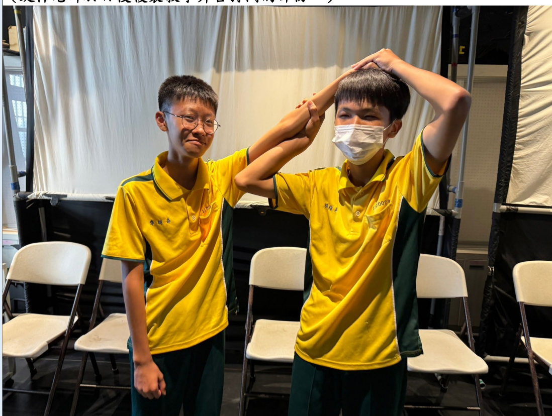
(鍵樺老師於日後複製教學舞台打鬥的部份。)