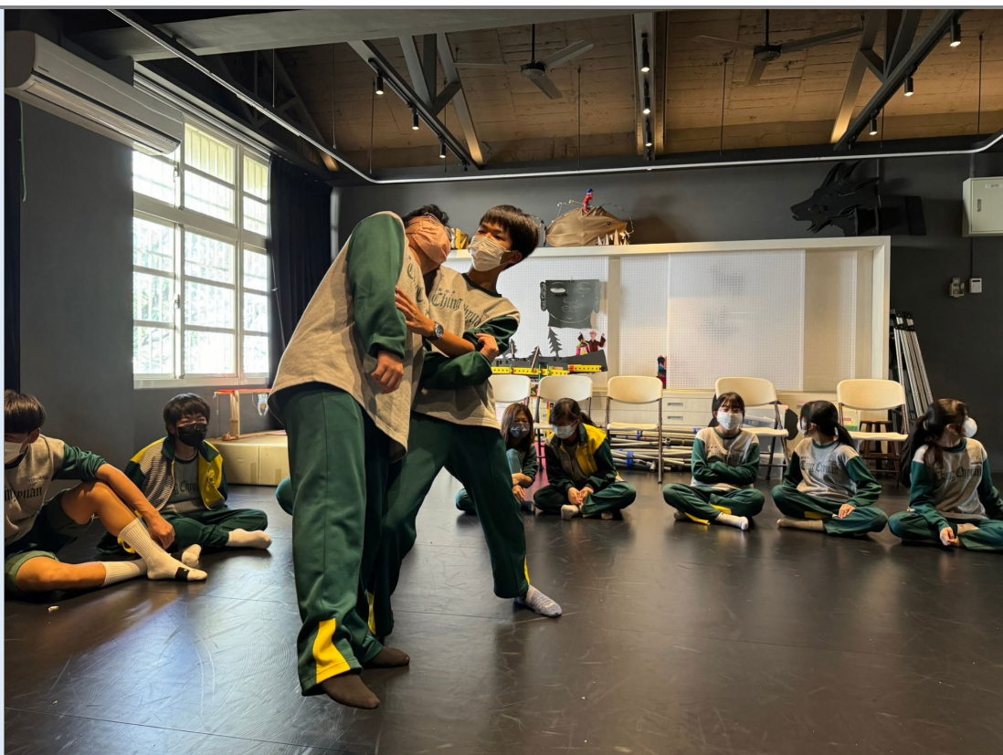
(鍵樺老師於日後複製教學舞台打鬥的部份。)