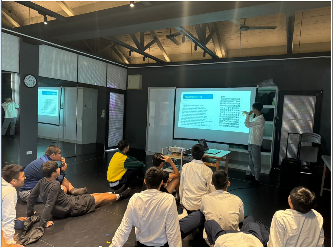
(鍵樺老師複製教學-介紹羅密歐與茱麗葉開場詩的部份。)