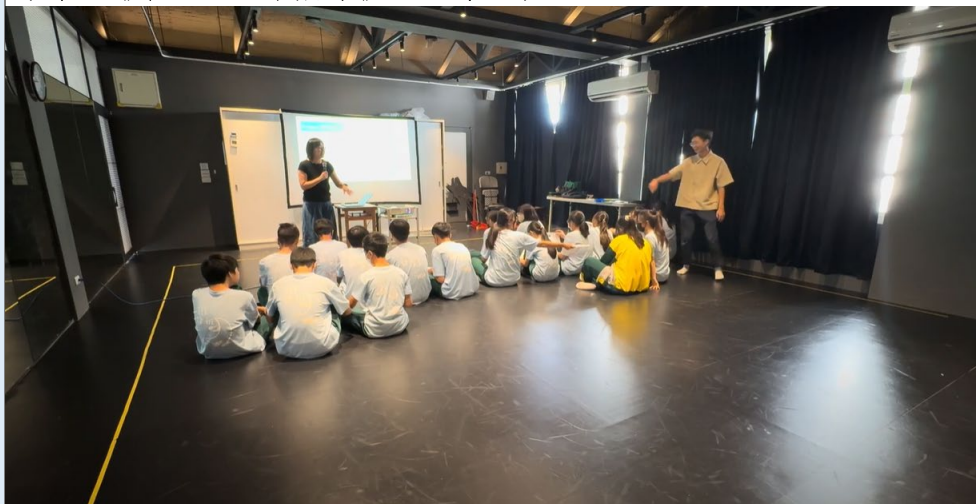
(《羅密歐與茱麗葉》英文劇本導讀。)