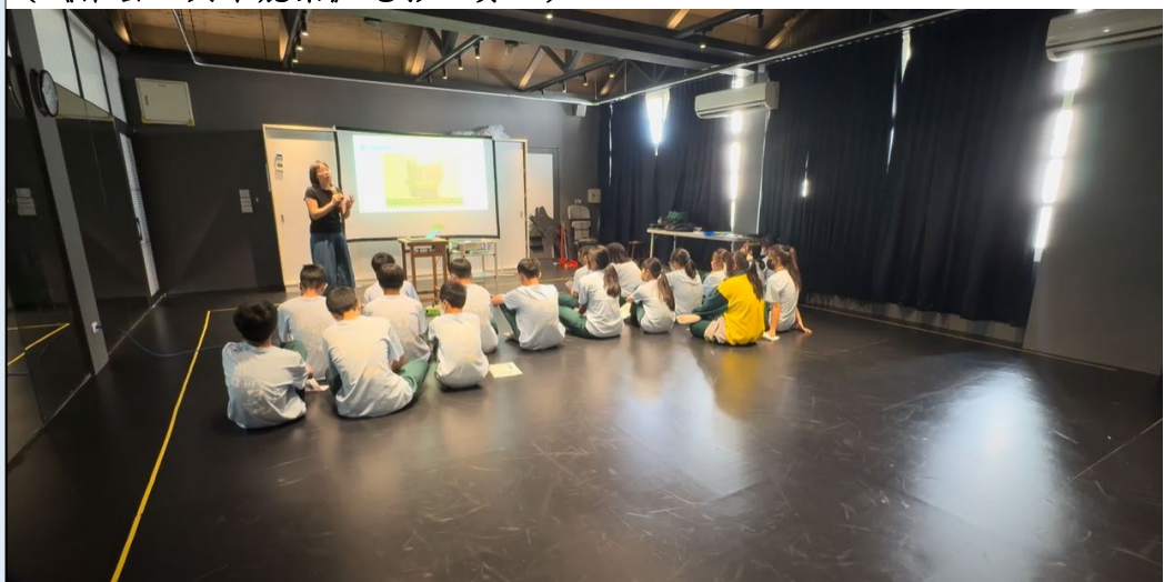
(講述羅密歐與茱麗葉的年紀與學生相仿，並介紹青少年的大腦構造。)