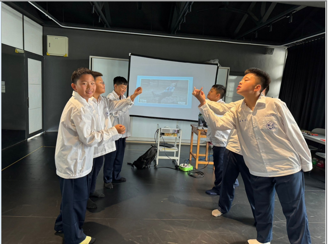
(鍵樺老師複製教學-以故事圈描述羅密歐與茱麗葉故事的部份。)