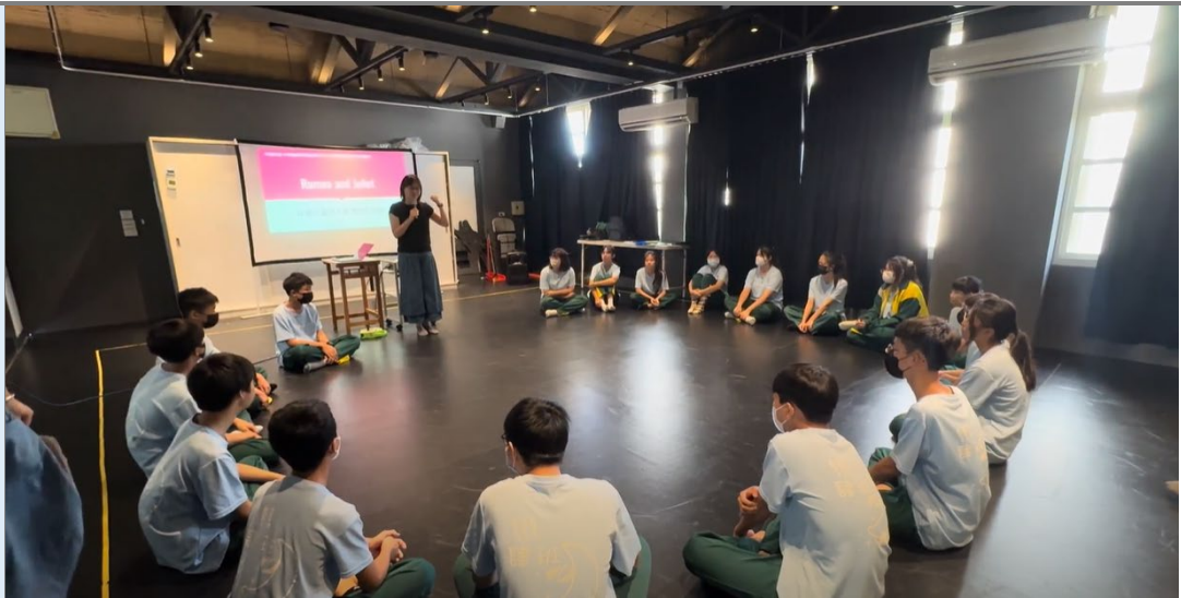
(詢問學生對羅密歐與茱麗葉了解多少。)