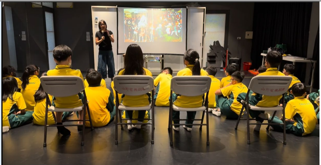
(古代劇場觀眾階級介紹。)