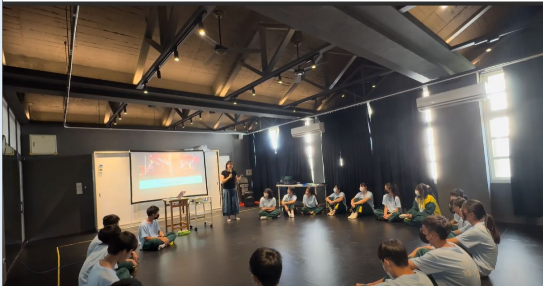
(講述《羅密歐與茱麗葉》的故事。)