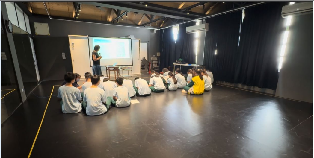
(學生讀《羅密歐與茱麗葉》英文開場詩。)