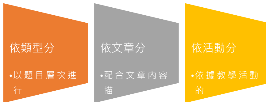
圖 3 提問教學運用形式

在提問教學的運用上，可依類型、文章、活動進行區分，從類型分，可從題目的層次依序提問，若以文章的書寫內容來看，可以作者描述的歷程提問，另外，教師也可依自己的教學活動安排設計提問。以不同的提問運用進行教學，成效各有不同，視教師的教學目的進行使用。