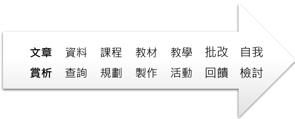
圖 2 課程準備流程

從課程準備流程來看，教師在賞析完課文，分析出「線索埋藏」、「題目多重意涵」、「心情變化」、「文章中的情感表達」、「情節轉折」、「人物形象」六項文章特色，可訂定為教學重點，引領學生學習，接著翻閱習作的設計，並查閱教學相關資源，如教師手冊等，發現本課屬於「作家風華」單元，單元目標希望能藉由作家作品，認識經典作家，且本課為小說，小說書寫有著「開始」、「發展」、「高潮」、「結局」的情節設計，其中「高潮」更是歐·亨利小說精彩之處。