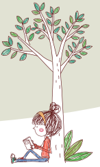
教案設計檢測項目參考檢核重點與評量準則說明（以高中國文為例）