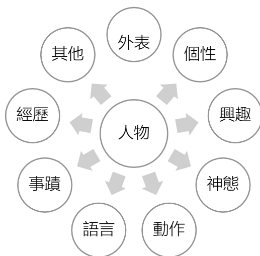
圖一 寫人的發散性思考圖